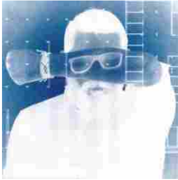
una delle fotografie di Tommaso Mori usando la tecnica della cianotipia